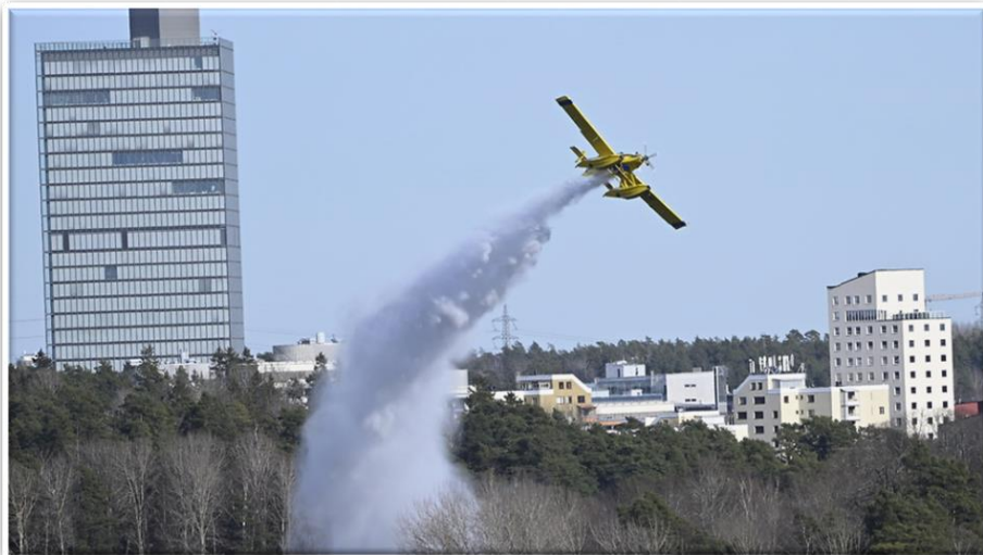
RescEU firefighting aircrafts