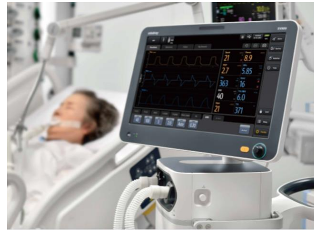
RescEu Medical Stockpile